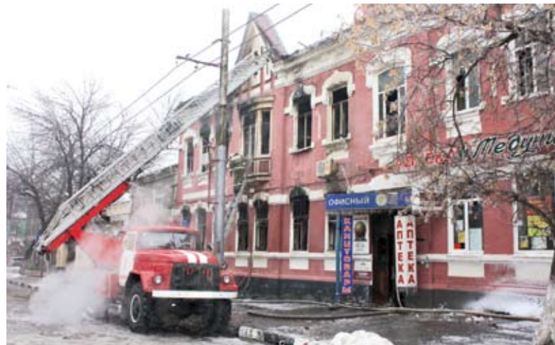
Фасад памятника архитектуры сохранился и будет восстановлен