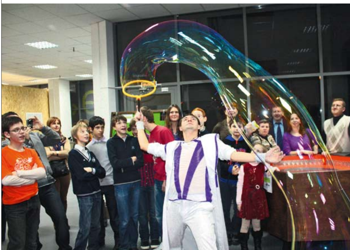
Шоу мыльных пузырей