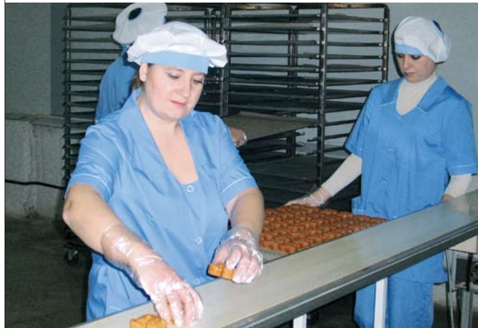
Сладости — бренд Пензенской области

Губернатор Пензенской области Василий Бочкарев продолжает знакомиться с деятельностью предприятий, имеющих перспективы развития и точки роста. На прошлой неделе он посетил кондитерское производство ООО «Северянин».