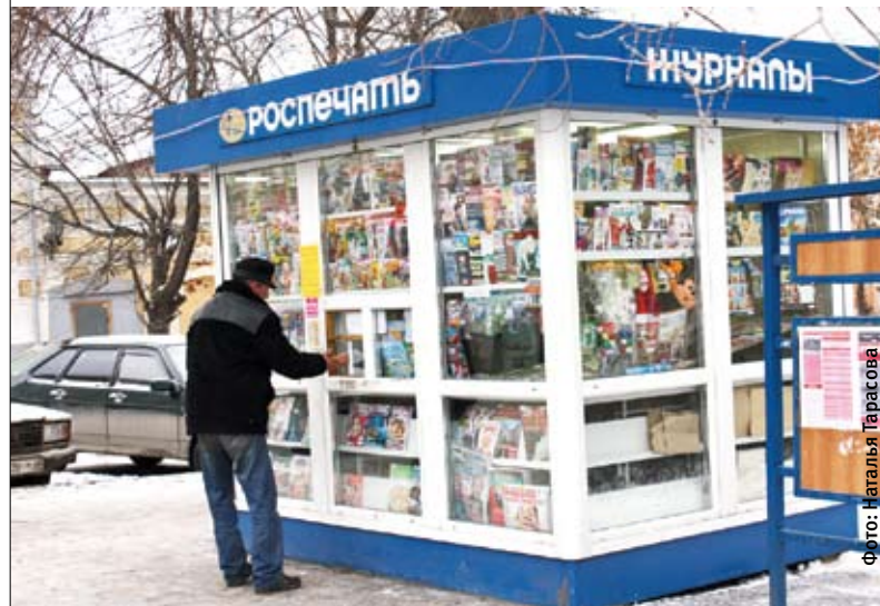
Этот газетный киоск оказался в числе тех, что портят облик города

По его словам, при такой системе пресса «скоро погибнет». «Необходимо взять эти киоски и выставить их на аукцион, нужна конкуренция», — сообщил главный редактор газеты «Время».