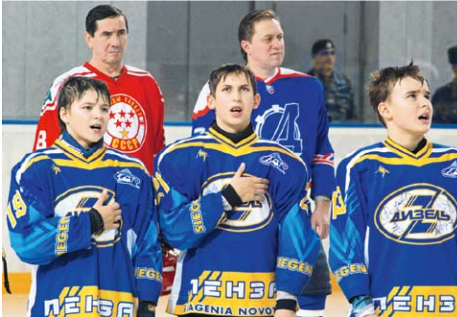
Два поколения хоккеистов

Эстафету поздравлений подхватили легендарный советский вратарь, президент ФХР Владислав Третьяк и прези-