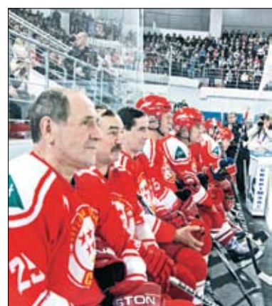
В Пензе открылся Ледовый дворец