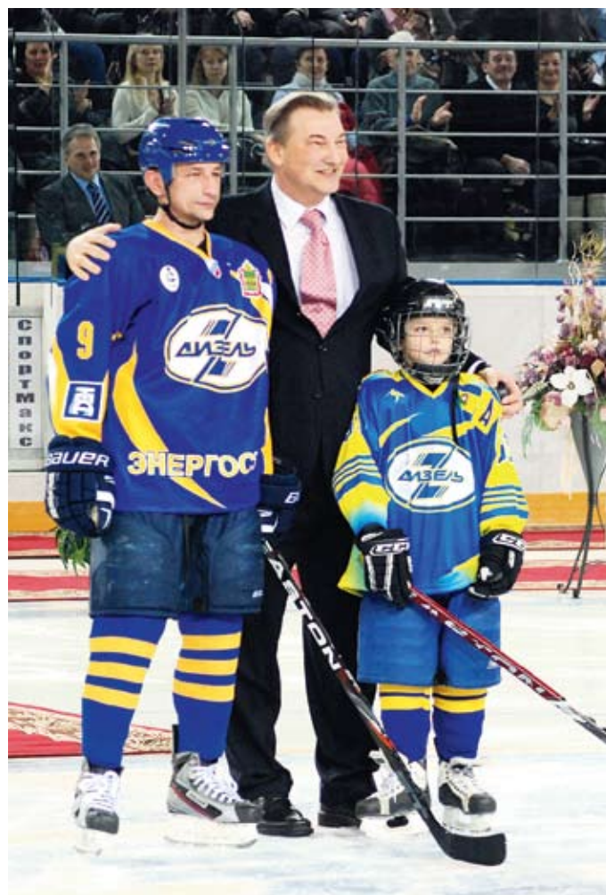
Владиславу Третьяку понравилась новая арена