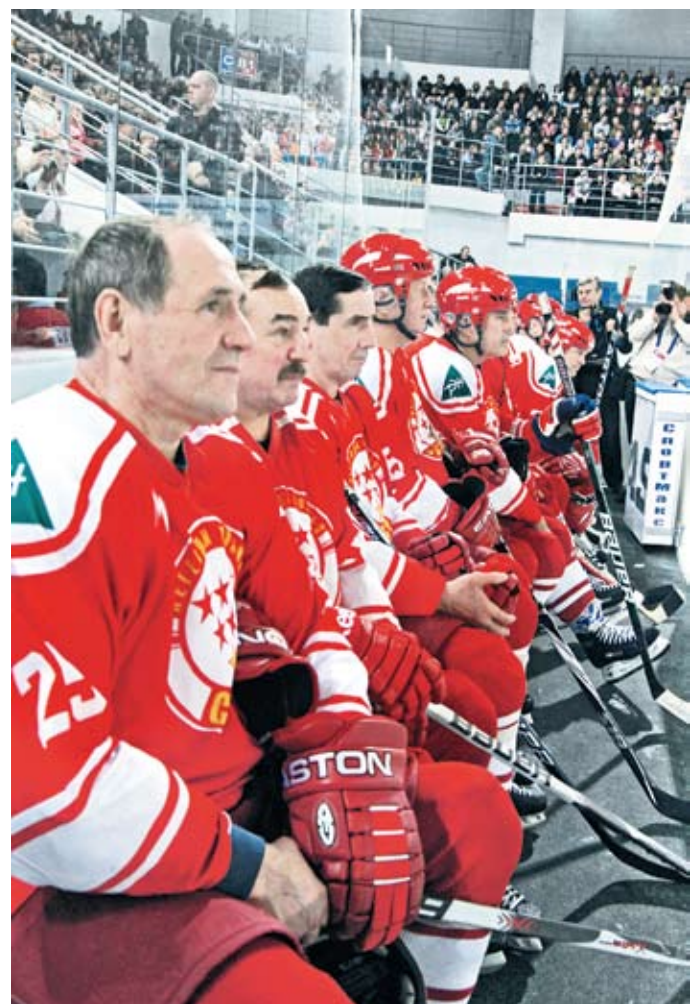
Не стареют ветераны!

Кстати, в перерыве болельщики не скучали, наблюдая за показательными забегами лучших пензенских мастеров шорт-трека. Завершилась церемония праздничным салютом.