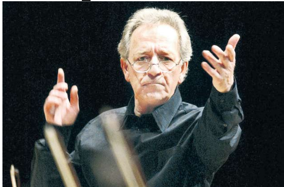
Второе выступление заслуженного коллектива в регионах России за 25 лет

Гастроль в Саратове Академического симфонического оркестра Санкт-Петербургской филармонии под управлением народного артиста СССР Юрия Темирканова уже сегодня можно смело назвать событием года в культурной жизни Саратова. Два концерта в Саратове — второе выступление прославленного Заслуженного коллектива России в регионах страны за 25 лет.