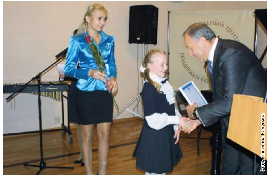
Награждение лауреатов показало: