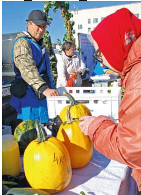
Приятных сюрпризов для пензенцев хватит на всю осень

→ стр. 1 Цены не кусались. Картошка — 8-9 рублей за килограмм, капуста — 7 рублей, лук — червонец. Цены на овощи, установившиеся на сезонной ярмарке в сентябре этого года, — на 10 процентов ниже магазинных.