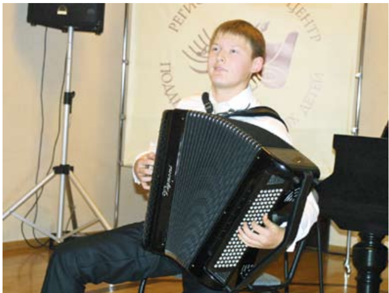
Саратовская область по-прежнему щедра на таланты

К счастью, именными стипендиями поддержка талантов не исчерпывается. В рамках целевой программы финансируется поездка участников на различные конкурсы и фестивали России. По сравнению с прошлым годом процент призеров всевозможных творческих форумов самых высоких уровней увеличился почти вдвое. А это значит, что саратовские уникальные культурные традиции находят продолжение в новых поколениях.