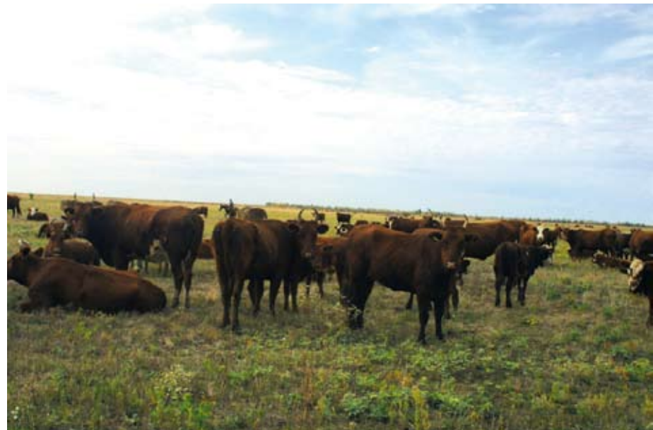
Стадо КРС калмыцкой породы на просторах Ровенского района

Кстати, на этой неделе правительством области было заключено соглашение о реализации подобного инвестиционного проекта. В области планируется создание комплекса по производству высокопродуктивного мясного поголовья КРС и комплекса по убою и первичной переработке скота. Инвесторы планируют создать в области ряд сооружений для содержания животных в зимнеотельный период, фидлот (откормочник), кормо-