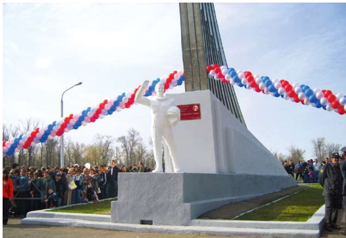
Место приземления Юрия Гагарина — уникальный исторический памятник

Особый шарм некоторые энтузиасты находят в посещении заброшенных населенных пунктов. В этих поселках-призраках нет жителей, но есть множество объектов культуры. Так, посреди просторов хвалынского поля стоит одинокая каменная Спасо-