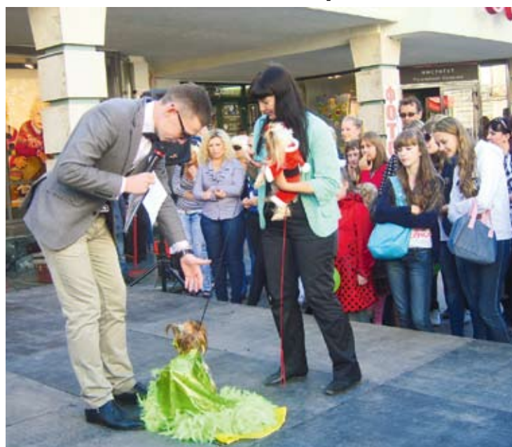
В Саратове прошло необычное модное дефиле

Необычное дефиле прошло на проспекте Кирова в Саратове. Модные тенденции сезона продемонстрировали саратовцы и их четвероногие питомцы.