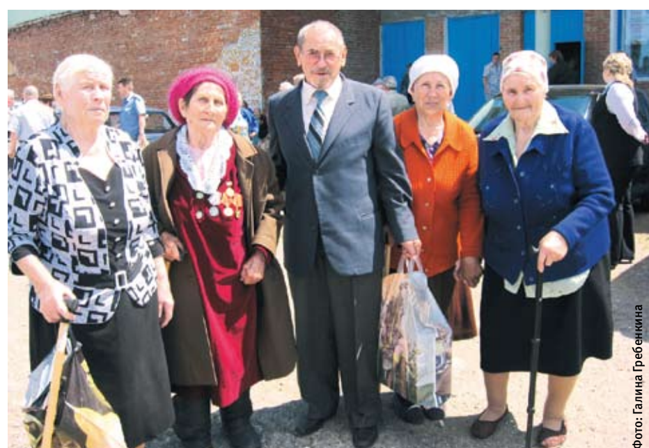
Ветераны Клиновской больницы на юбилее