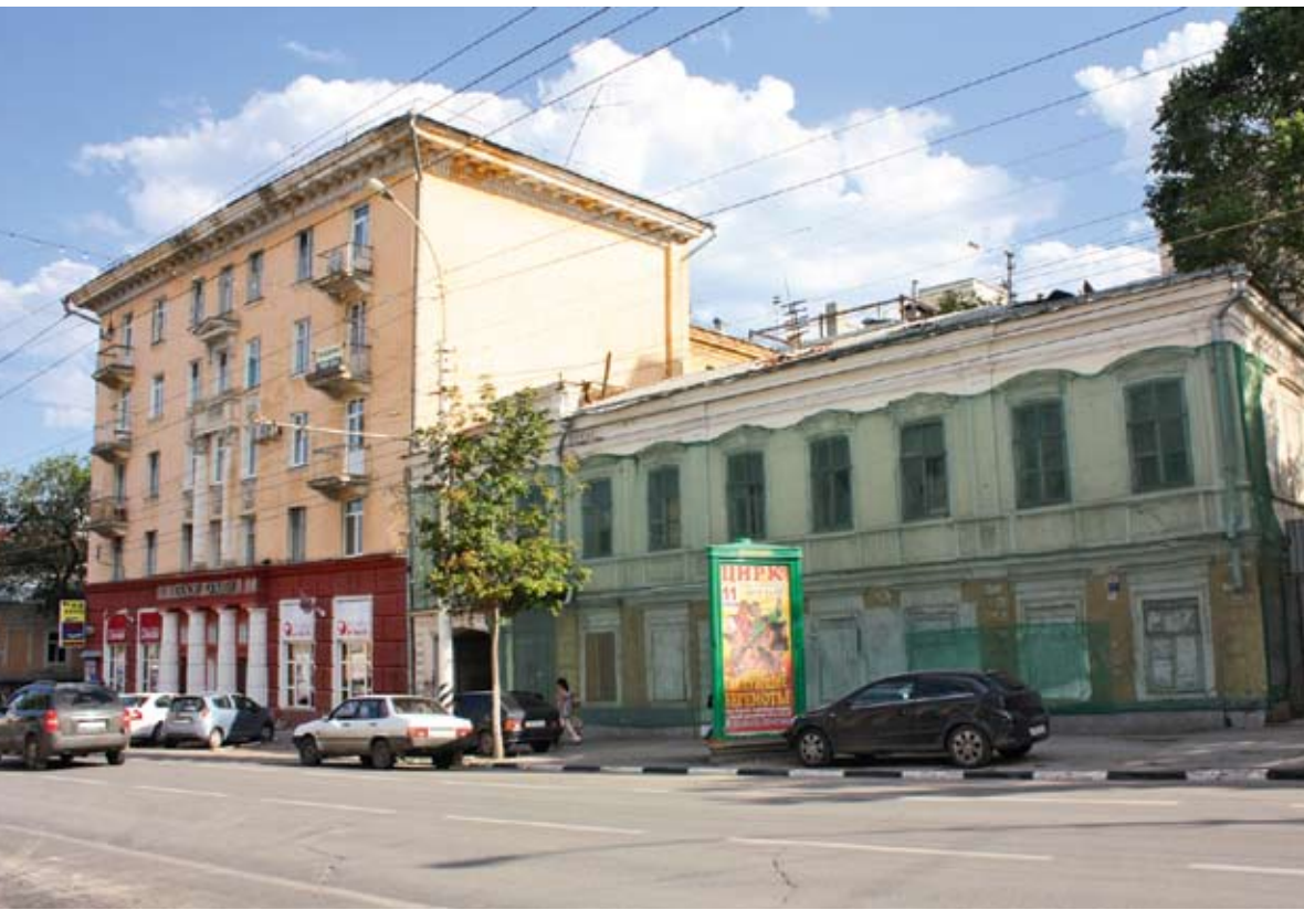
В исторической части города станет меньше рекламы