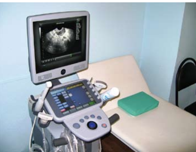
Новейшее оборудование, полученное по программе модернизации здравоохранения

В этом году также запланировано проведение ремонтных работ. На эти