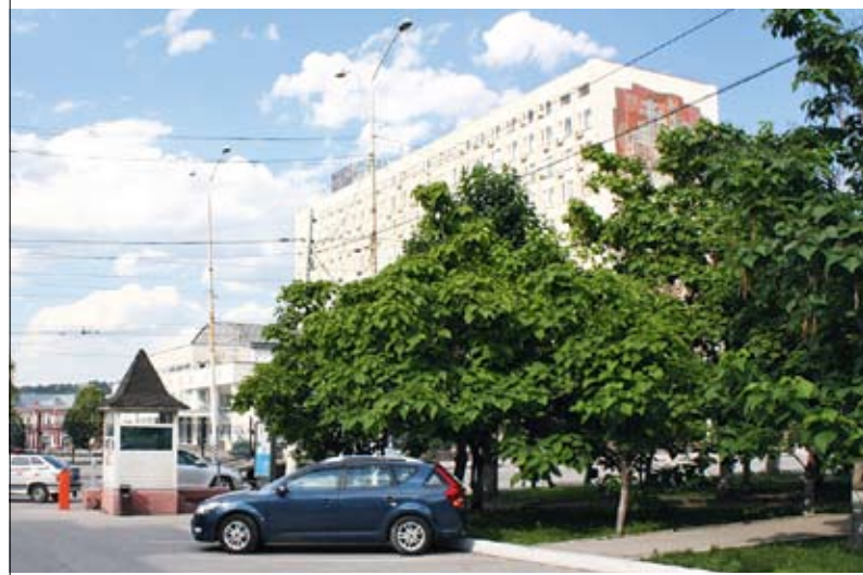
В этом помещении поста застрелился полицейский

Личность умершего установлена, мужчине было 52 года. По факту его смерти продолжается доследственная проверка.