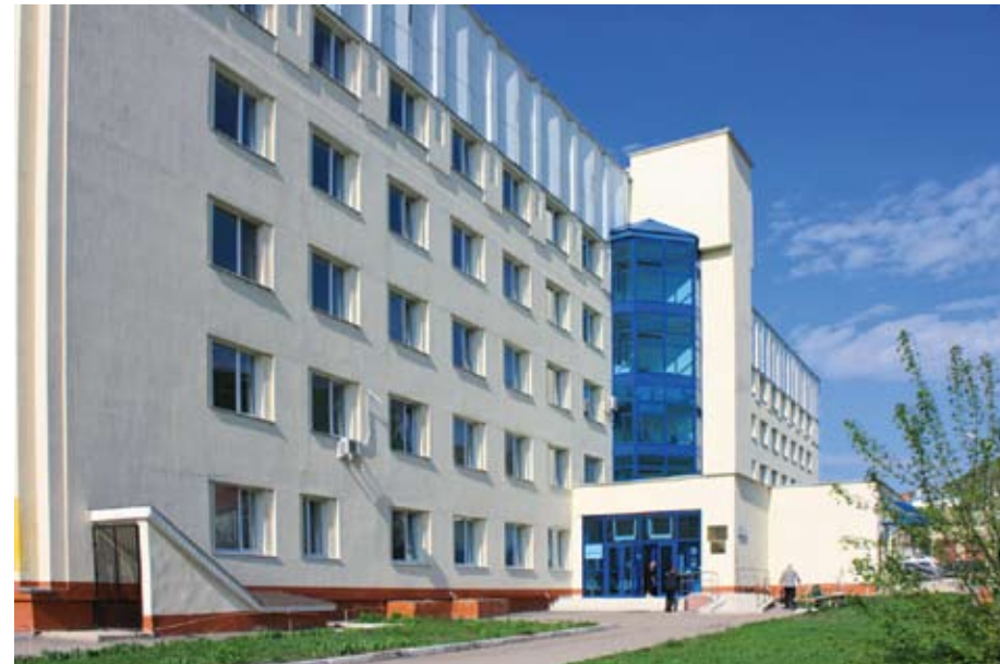
Областной онкодиспансер №2

— Да, с февраля этого года мы практически взяли на себя функцию городского онкологического диспансера. В нашем поликлиническом отделении пациенты могут получить квалифици-