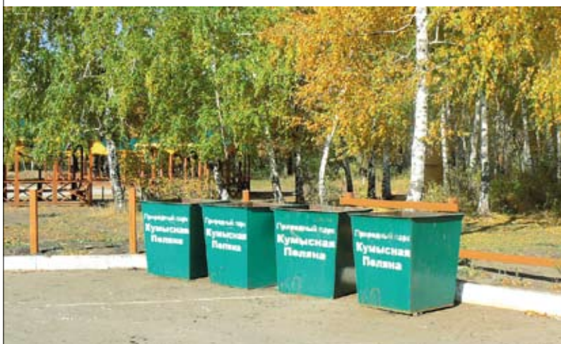
Ежегодно в области образуется до 900 тонн ТБО

Мусорные свалки разползаются по земле, как заразная болезнь. Они захлывают и загрязняют окружающую среду, постоянно дымят, загораются и представляют серьезную угрозу здоровью человека. Проблема ликвидации свалок в лесных массивах и дачных кооперативах посвятил свою первую пресс-конференцию на минувшей неделе новый председатель комитета охраны окружающей среды и природопользования — министр Саратовской области Андрей Андрущенко.