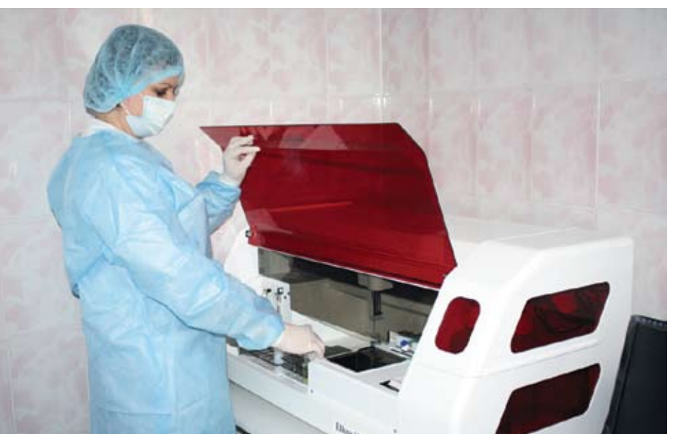
Проведение иммуноферментного анализа — исследование онкомаркеров