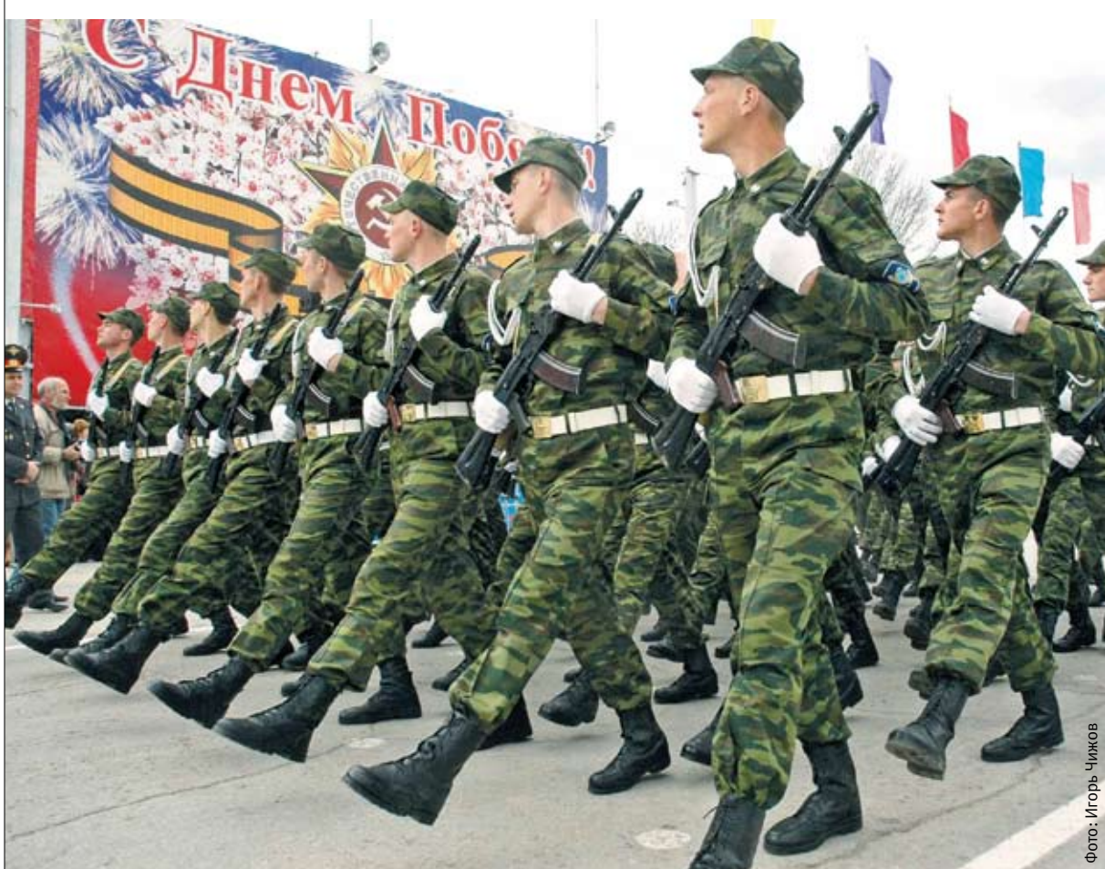
Равнение на победителей

— Пока оценку давать рано, — ответил депутат. — Жителям один совет: идти в суд и доказывать свои имущественные права. Похоже, что продано было гораздо больше, чем построено.