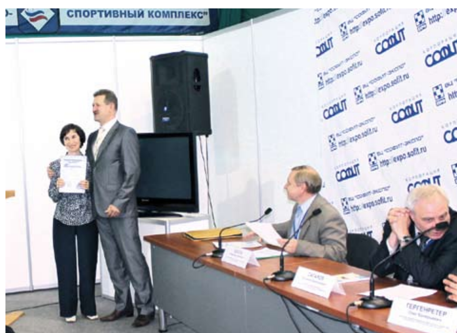
Вручение благодарности от Агентства энергосбережения нашей газете за сотрудничество

— Наша задача — заполнить животноводческую нишу. Первым шагом должно стать производство сырья. Вторым — переработка. Строительство мясоперерабатывающих предприятий в регионе — тоже одна из основных задач, которую ставит перед собой саратовское правительство.