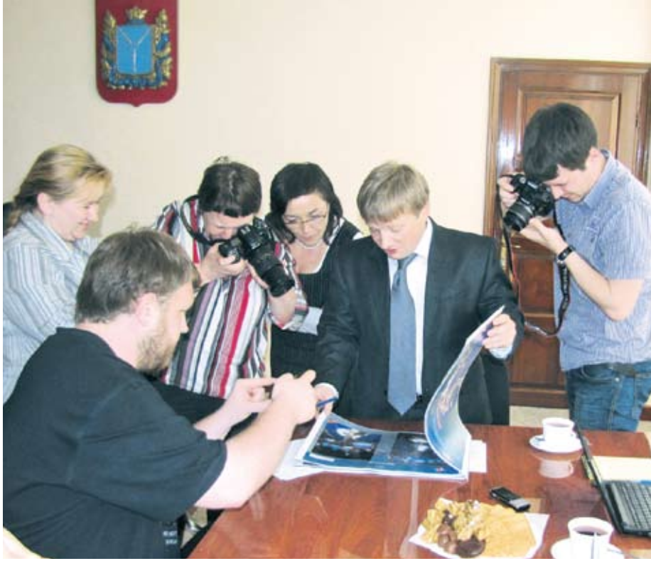
Самый большой интерес вызвал проект «Зеленый остров»

→ стр. 1 Создалось впечатление, что вопросы летели, как теннисные мячики в стену, и отскакивали от нее.