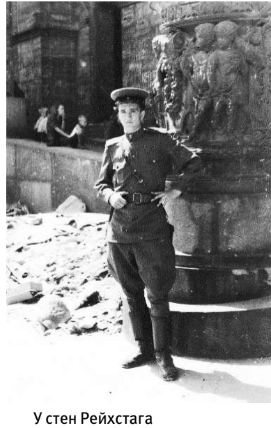
У стен Рейхстага