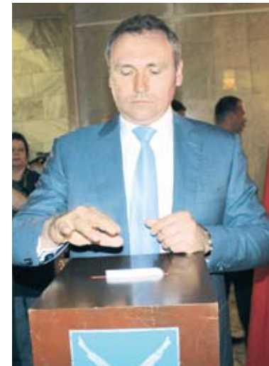
За руководителями КСП голосовали тайно

удивился и повторил, что «не имеет губернаторских амбиций», заверив, что еще четыре года намерен управлять Саратовом.